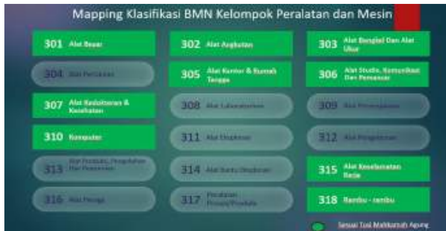
Gambar 3: Kebijakan Kodefikasi BMN untuk Peralatan dan Mesin di Mahkamah Agung